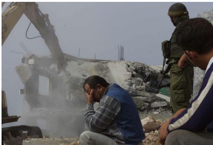
Démolition par Israël de maisons de Hiérosolymites Palestiniens à Beit Hanina, 29 Octobre 2013.

Notons que ces chiffres incluent les cas persistants d'expulsion de la population palestinienne d'Israël qui s'élève aujourd'hui à 7 millions de réfugié-e-s et de personnes déplacées. Toutefois, 65 des 150 nouveaux cas de la région MENA (43%) qui ont été enregistrés au cours de la période d'examen indiquent le déplacement permanent qu'Israël continue de mener contre le peuple palestinien des deux côtés de la Ligne verte (au moins 80.635 personnes nouvellement déplacées en Israël/Palestine et 714.812 en Palestine occupée).