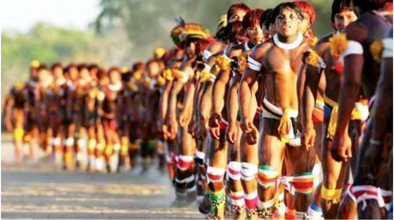
Des hommes Xavantes locaux de Marãiwatsédé (Mato Grosso, Brésil) manifestent contre les expulsions forcées d'occupation de terre des autorités et des intérêts commerciaux en Janvier 2013.

Egalement dans la région d'Afrique francophone, les expulsions et les déplacements résultant de conflits ont affecté, dans le cas de la Côte d'Ivoire, 450.000 personnes en 2010-2011. Cependant, ce nombre n'atteint plus que 70.000 personnes à l'heure actuelle 19 .