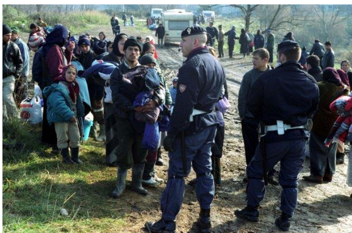
En 2010, les autorités à Milan on réalisé au moins 61 expulsions forcées de Roms et de Sinti.

En Europe, les 71.300 personnes victimes d'expulsion des 22 lamentables cas enregistrés dans la BDV sont plutôt uniformément distribuées à travers le continent. Depuis 2010, les autorités centrales et locales ont effectué des expulsions forcées au Danemark, en Angleterre, en France, en Géorgie, en Allemagne, en Hongrie, en Italie, en Roumanie, en Russie, en Espagne, en Suède et en Ukraine. Alors que l'Ukraine était le seul cas où les expulsions allaient de pair avec le conflit armé, (voir le cas « displacing thousands »), la France et la Roumanie rivalisaient pour la palme de responsable d'expulsion le plus fréquent, tout particulièrement de ceux ayant pour cible les communautés Roms. Toutefois, le Danemark, l'Italie