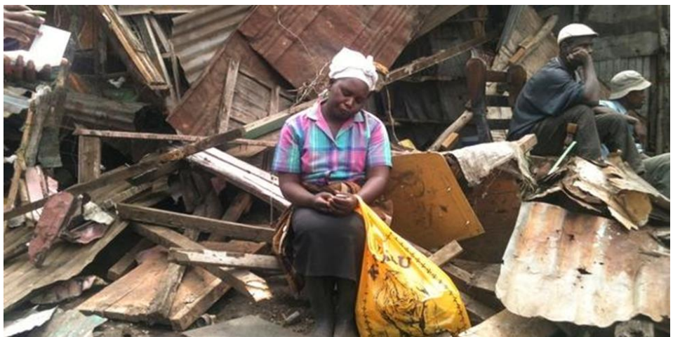
La moitié des habitant-e-s de Nairobi, Kenya vit dans des slums. Le nouveau projet de loi n'a pas encore protégé beaucoup de personnes des expulsions forcées.

Huit des 29 cas d'évictions d'Afrique anglophone enregistrés sur la période en examen se situent en Afrique du Sud. Au moins 6.000 personnes ont été expulsées de force par des moyens administratifs ou d'autres, y compris les célèbres cas de Kennedy Rd., les incendies de Durban, déplaçant 4.000 personnes en Juillet et Août 2010.