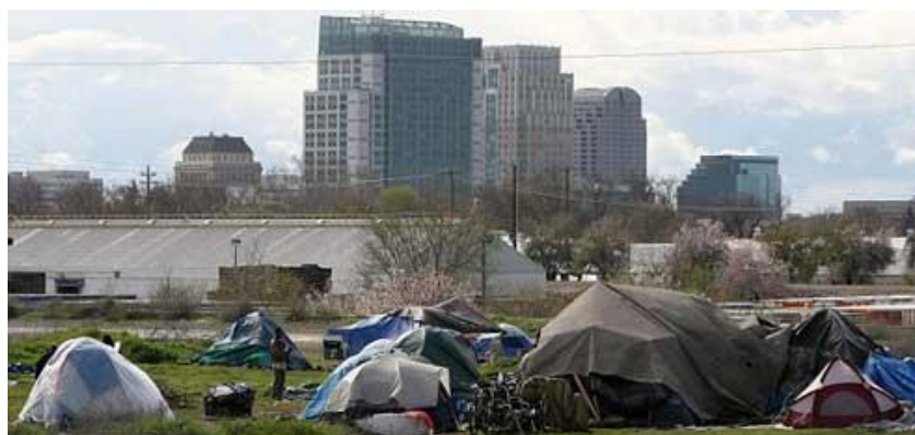
La ville-tente des victimes de saisies, Sacramento CA (USA), 2012.

Toutefois, le nombre actuel de personnes victimes d'expulsions en Amérique du Nord ne contemple pas la situation persistante des victimes des expulsions sans abri en raison de la subprime et des crises financières connexes depuis 2008. Cette démonstration stupéfiante d'échec de la gouvernance a donné lieu à des pétitions, des poursuites et des recours en justice qui, dans certains cas, promette une compensation pour les millions de propriétaires et de locataires affectés. Quoiqu'il en soit, malgré ces efforts de redressement de la part du gouvernement, des particuliers et des organisations, cette période se termine avec des estimations variables 21 du nombre de