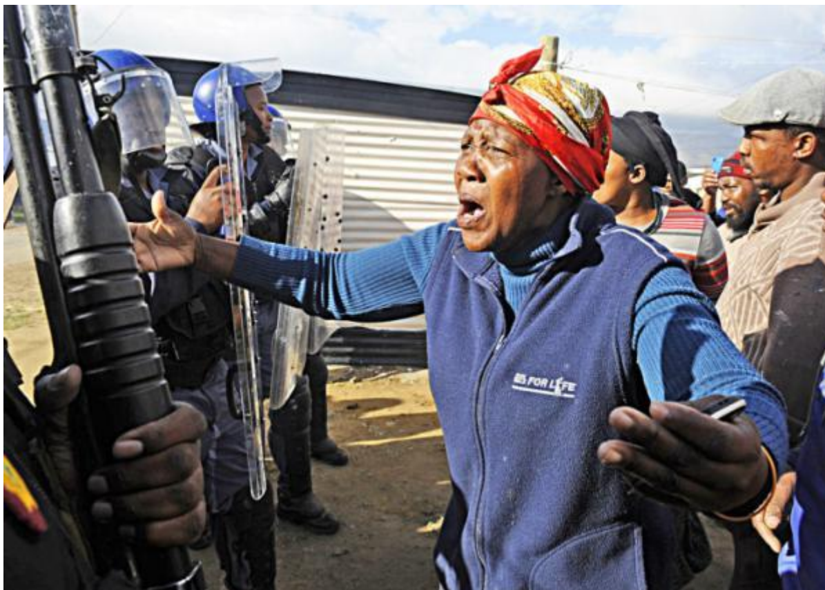
L'établissement informel de Lwandle à Cape Town a réveillé de douloureux souvenirs d'apartheid d'il y a 20 ans en Juin 2014: + de 200 baraques brûlées et démolies, laissant à la rue des familles désespérées. Réviser le cas Nomzamo (Lwandle) sur la BDV.

personnes sans-abri, tandis que les forces de sécurité empêchaient une délégation locale de rejoindre la communauté assiégée afin de lui fournir assistance.