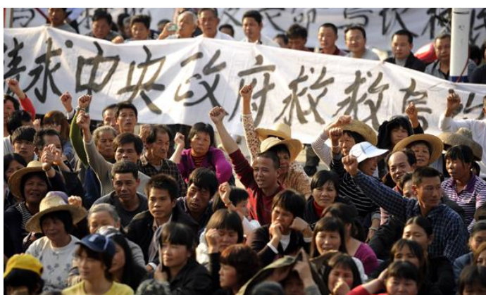
A Wukan, le village emblématique de la Province de Guangdong en Chine, trois mois d'expulsions et de saisies des terres a abouti à une révolte, Décembre 2011.

La majorité quantitative de cas d'expulsions forcées enregistrées dans la BDV sont attribués à l'Inde (15 sur 52), avec 141.701 victimes. Un cas unique a impliqué l'expulsion forcée de 120.000 personnes au centre des affrontements meurtriers de la ville de Jharkhand de Dhanbad , chantier de la Bharat Coking Coal Company Ltd.